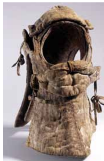
Helmhaube, deutsch, um 1470, DHM