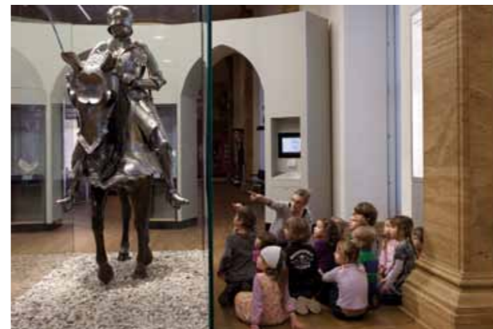
Kinderprogramm „Ritter, Burgen und Turniere“

Vom 12.6. bis 30.10.2010 zeigt die Burg Ziesar die Ausstellung „ Raben- schnabel und Hodendolch. Schutz- und Trutzwaffen der Ritter “.