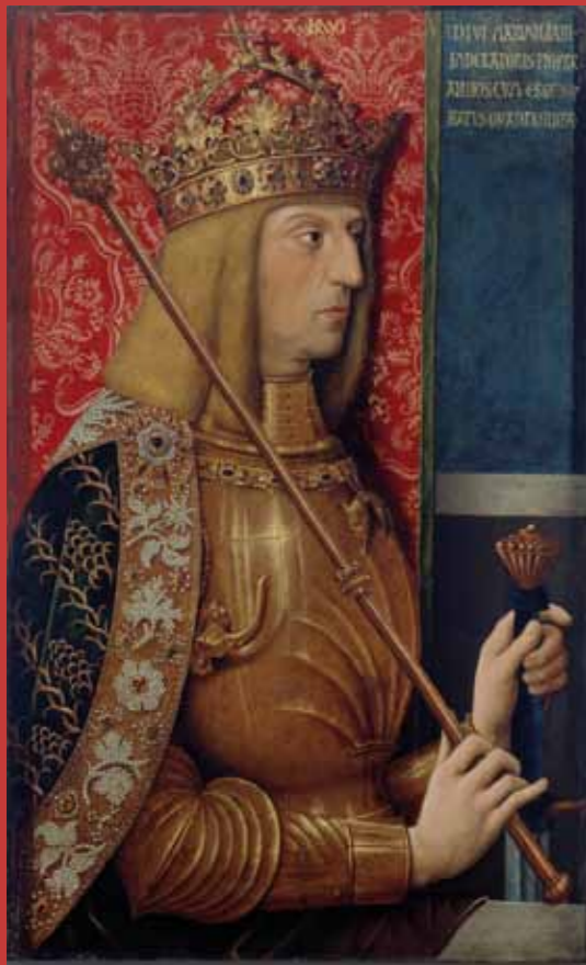
links: Kaiser Maximilian I. – der »letzte Ritter«, Bernhard Strigel, datiert 1496, DHM