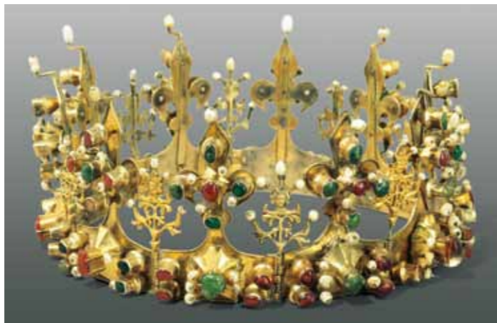
oben: Krone der Maria von Luxemburg, 1350-70, Zveta Marija (Benediktinerinnenkloster St. Marien), Muzej S. I. C. U. Zadar, rechts: Herzogsbrief für Graf Eberhard V. von Württemberg, 1495, Landesarchiv Baden-Württemberg, Hauptstaatsarchiv Stuttgart

Der Rundgang beginnt in der ersten Ebene mit dem adeligen Burgherrn und führt durch die Baugeschichte seiner Wohnsitze, vom befestigten Bauernhof bis zur spätmittelalterlichen Dynastenburg. An die Inszenierung einer Hofstube als zentraler Ort der Herrschaft reiht sich die Burgkapelle des christlichen Ritters und die Rüstkammer seiner Waffen. Die zweite Ebene präsentiert um die Krone der Maria von Luxemburg eine Schatzkammer höfischer Kultur zwischen Jagd, Turnier und Eros, aber auch die wirtschaftlichen Grundlagen der Herrschaft. Breiter Raum ist der Burgendämmerung, dem tiefgreifenden Wandel der Burg an der Schwelle zur Neuzeit gewidmet. Hier schwand zwar die militärische Bedeutung der Burg, dennoch blieb ihr Wert als Verwaltungssitz, standesgemäße Wohnung oder Erinnerungsort. Nicht nur Ruinen, sondern auch Wappen und der Begriff des „Bürgers“ erinnern bis heute an die einstige Bedeutung dieser Schauplätze europäischer Geschichte.