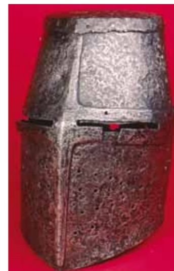
Topfhelm, deutsch, 2. Hälfte 13. Jh., DHM